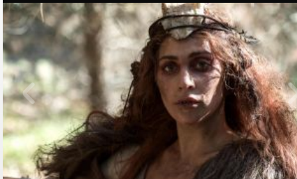
FOTO DI SCENA DI AMERICAN HORROR STORY